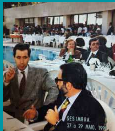
Congresso realizado em 1993, em Setúbal

Honro-me de ser seu discípulo: conheço muito bem o seu pensamento e a sua obra teórica (cerca de 30 livros, como autor, ou coautor e inúmeros artigos científicos e de análise), de que destaco o livro “Desporto Português: do estado do problema, ao problema do Estado”,